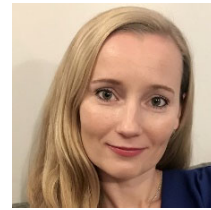
Angelika Vaasa 欧州議会 European Parliament